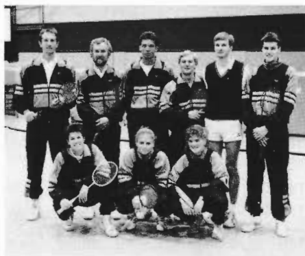
Kämpft in der 2. BuLi-West ums Überleben.

Und gleich am nächsten Tag folgte der nächste Punktverlust mit einem 4:4 gegen Beuel. Und die Beueler, immerhin 1981 + 1982 Deutscher Mannschaftsmeister, haben in dieser Saison mit erheblichen Schwierigkeiten zu tun. Die ehemaligen Europa- und vielfachen Deutschen Meister sind kein Garant mehr für Punkte und der Nachwuchs z. Zt. überfordert oder nicht geeignet. Nur gut für die Beueler, daß die 2. Mannschaft des FC Langenfeld bisher überhaupt noch nicht gepunktet hat und abgeschlagen den Weg in die Oberliga antreten muß. Mit im Abstiegstrudel steckt auch noch der BV Wesel RW, während sich die beiden Aufsteiger OSC Düsseldorf und SCU Lüdinghausen gut im Mittelfeld halten. H.H.