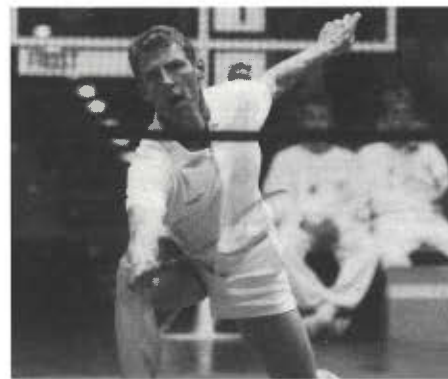
Die Badminton-Legende: Morten Frost – er wollte den Hat-trick, doch es kam ein schnelles Aus.

Halbfinale, wo er auf den Engländer Steve Butler traf, der sich jeweils bis zur Mitte eines Satzes tapfer wehrte, dann aber doch deutlich mit 15:8 und 15:9 die Segel streichen mußte. Zuvor konnte Butler im Achtelfinale für die kleine Sensation sorgen. Er bezwang die Nr. 9 der Weltrangliste und bei den German Open auf 3 gesetzten Indonesier Joko Suprianto mit 18:7/10:15 und 15:5.