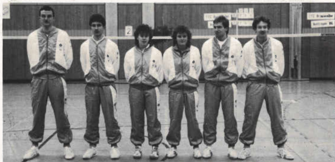
TTC Brauweiler (oben) und Bottroper BG